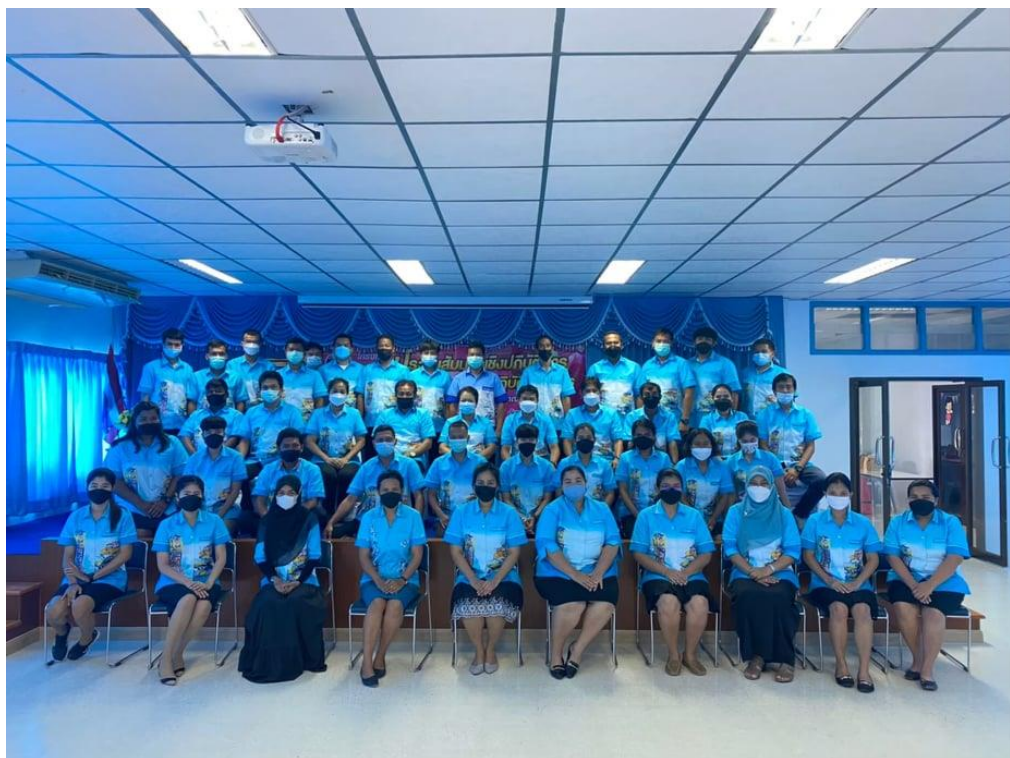
คณะครู และบุคลากรโรงเรียนกีฬาจังหวัดตรัง ถ่ายรูปร่วมกัน