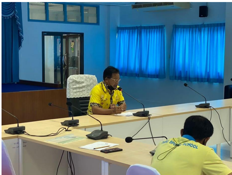
การทบทวนผลการดำเนินการตามแผนปฏิบัติการ ประจำปีงบประมาณ พ.ศ. ๒๕๖๔