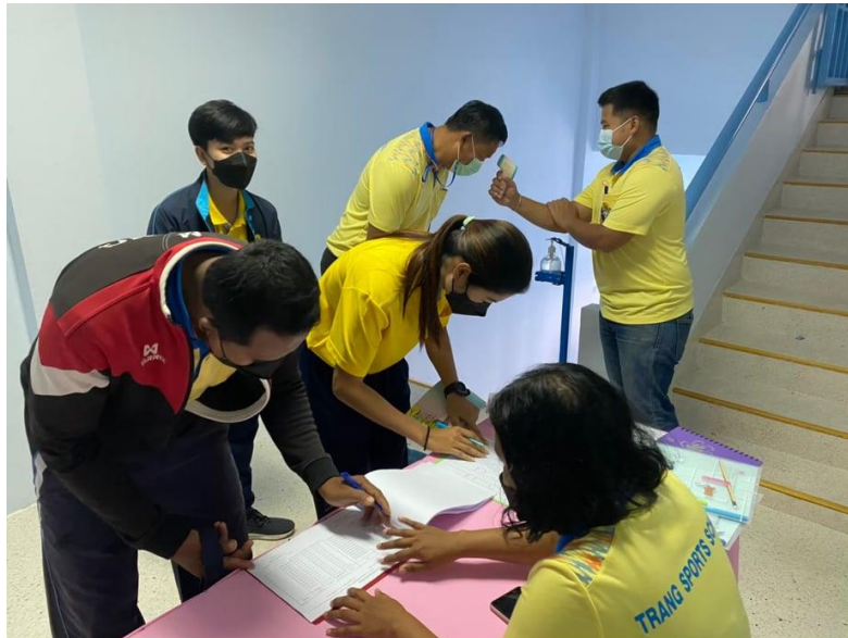
ลงทะเบียน

ระหว่างวันที่ ๒๐ - ๒๑ กันยายน ๒๕๖๔ ณ ห้องประชุมศรีตรัง โรงเรียนกีฬาจังหวัดตรัง