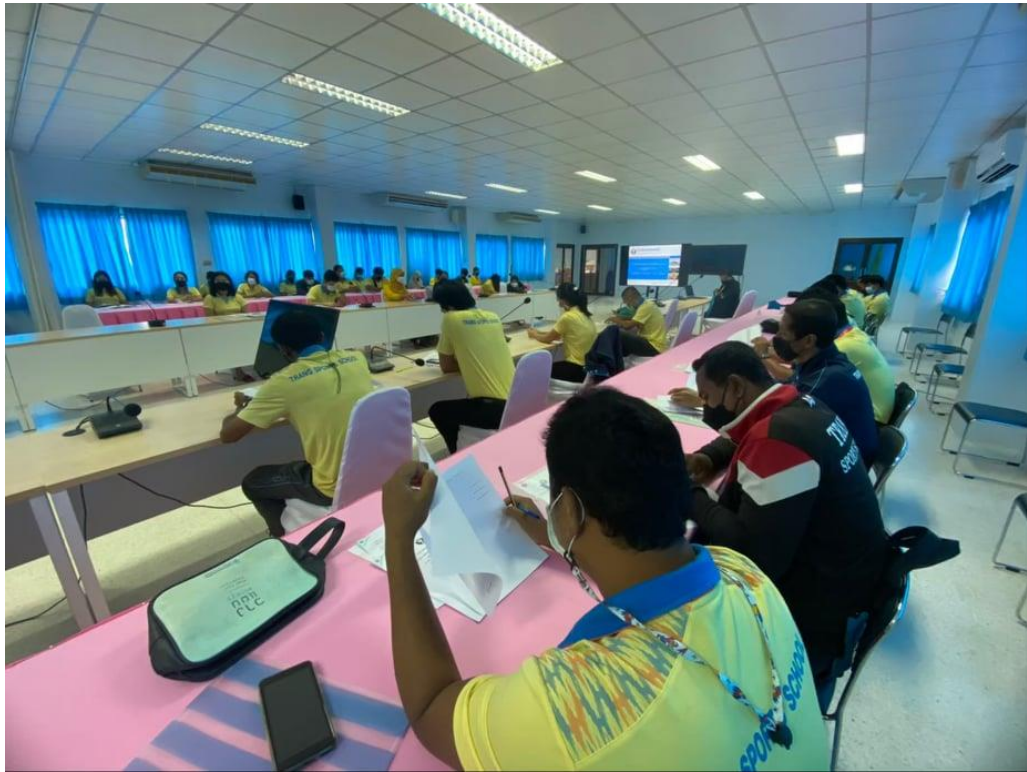
การอภิปรายผล