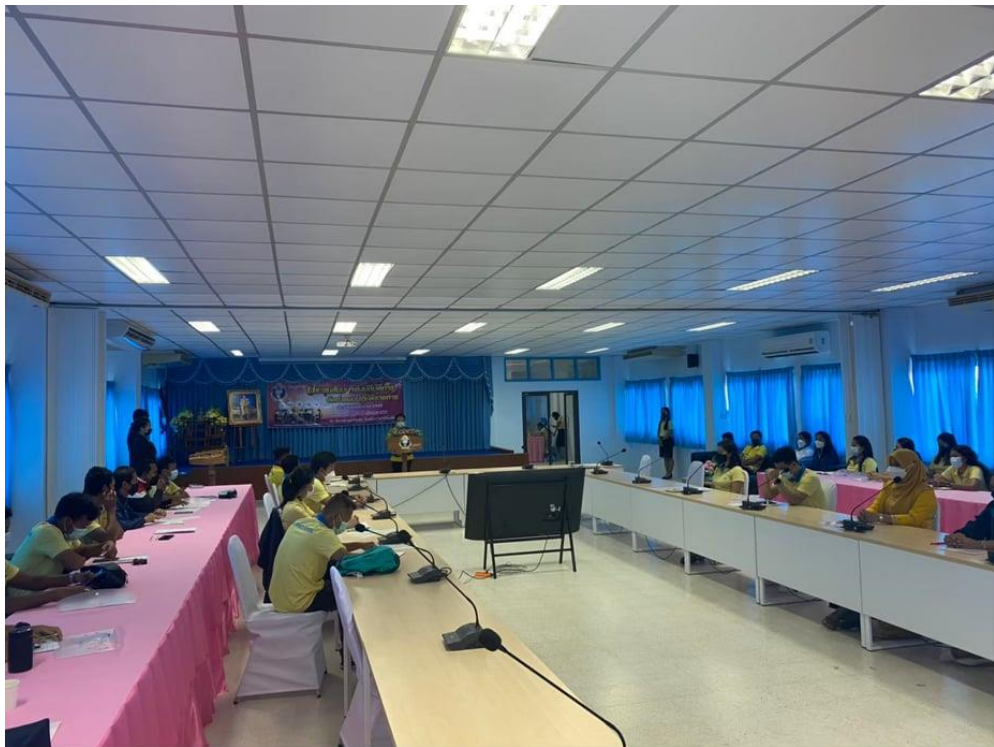
แนวทางการจัดทำแผนปฏิบัติการ ประจำปีงบประมาณ ๒๕๖๕