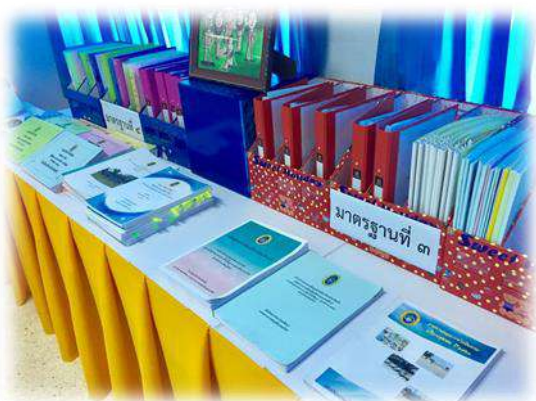
เอกสารและหลักฐานตามมาตรฐาน มาตรฐานที่ ๓ กระบวนการจัดการเรียนการสอน ที่เน้นผู้เรียนเป็นสำคัญ