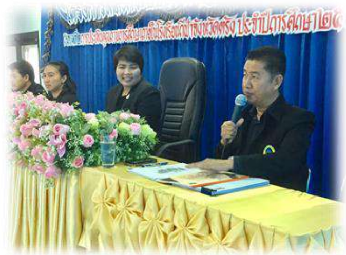
คณะกรรมการประเมินคุณภาพการศึกษาภายในโรงเรียนกีฬาจังหวัดตรัง