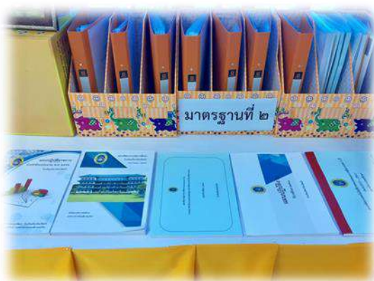
เอกสารและหลักฐานตามมาตรฐาน มาตรฐานที่ ๒ กระบวนการบริหารและการจัดการ