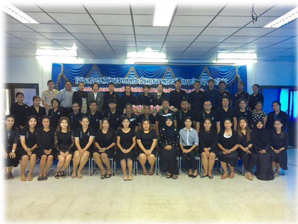
ผู้เข้าร่วมการประเมินคุณภาพการศึกษาภายในโรงเรียนกีฬาจังหวัดตรัง