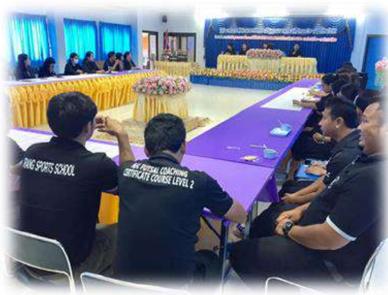
การประชุมเพื่อสรุปผลการประเมินคุณภาพการศึกษาภายในโรงเรียนกีฬาจังหวัดตรัง