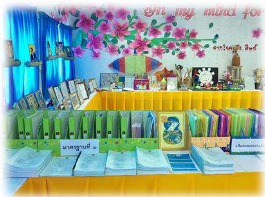
เอกสารและหลักฐานตามมาตรฐาน มาตรฐานที่ ๑ คุณภาพของผู้เรียน