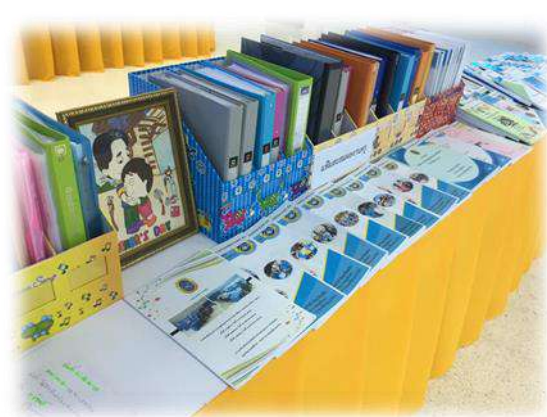
เอกสารและหลักฐานตามมาตรฐาน มาตรฐานที่ ๔ ความโดดเด่นด้านกีฬาของโรงเรียนกีฬา