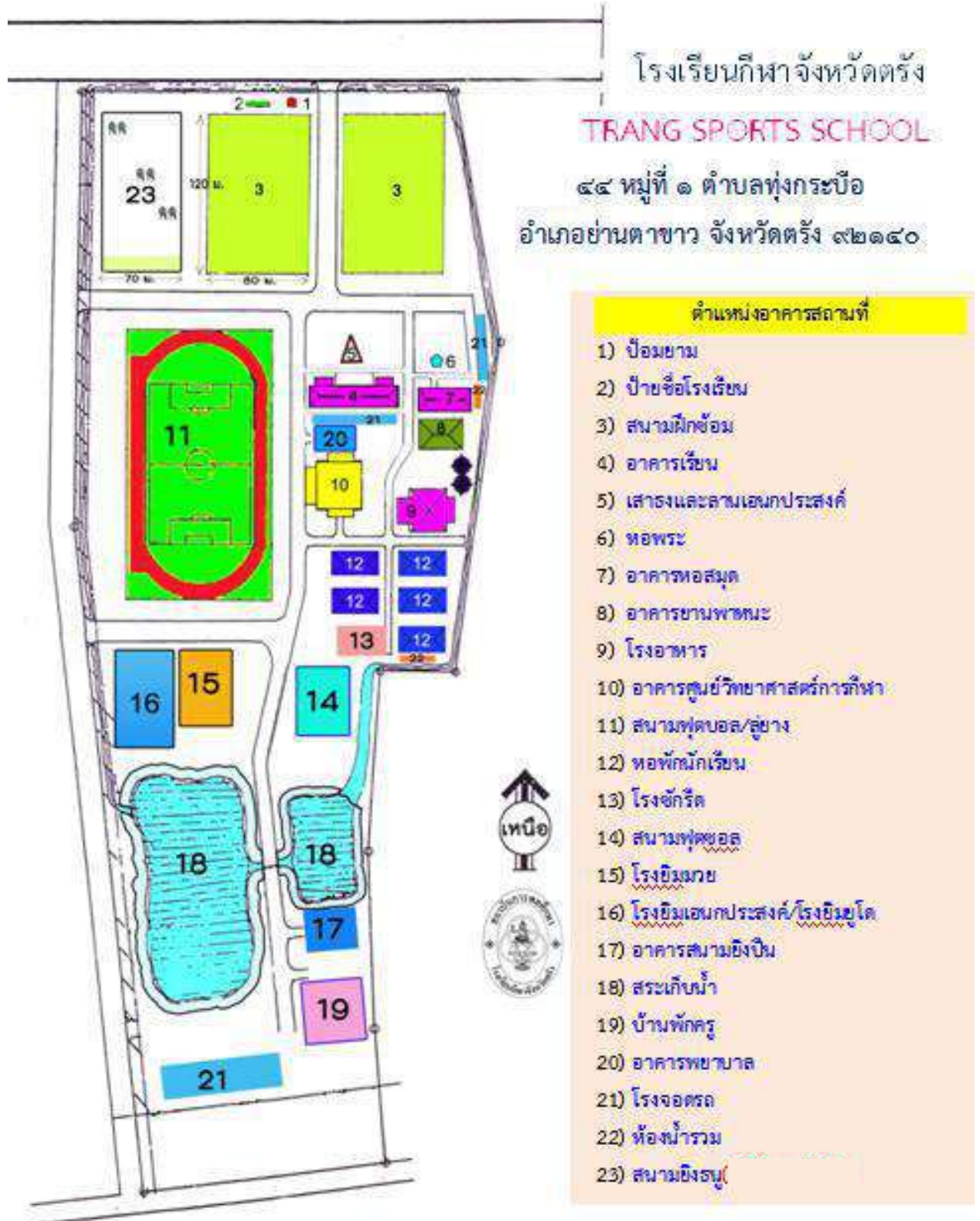
ตำแหน่งอาคารสถานที่